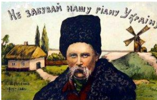
ПОШТЕРКА ДО ПЧАТКУ ЖИТТЯ ШЕВЧЕНКА

- Дай сили, Тарасе! Допоможи підвестися Україні з колін... – думала крізь сон і провалювалась у ніч.